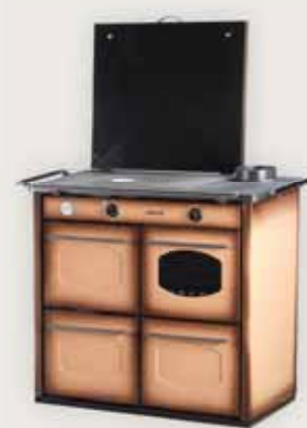
198 T Marrone