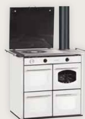
198 T Bianco