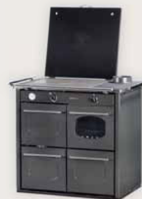
198 T Fucile